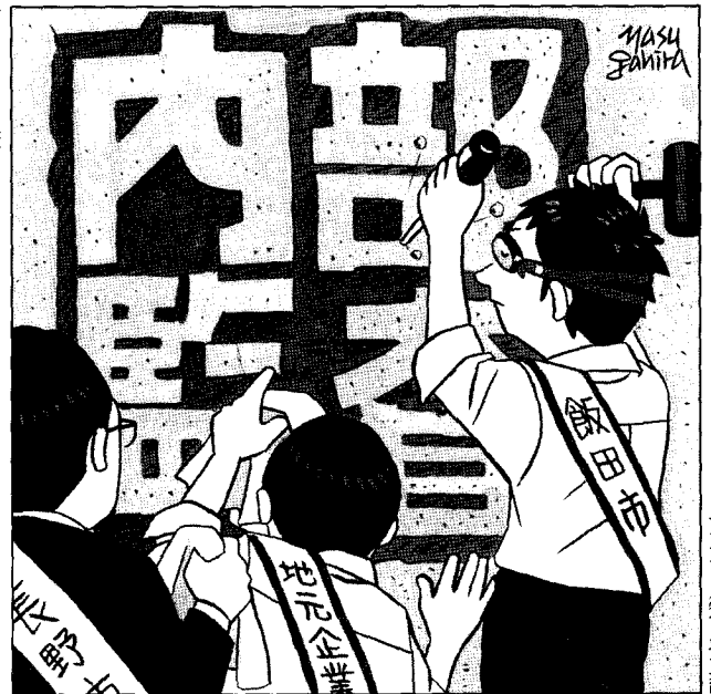
イラスト/安ヶ平正哉

飯田市は、内部監査への参加に当たり、両市の環境マネジメントシステムの文書・記録を徹底的に読み込んだ。規模の違いから、業務の範囲や流れの違いはあるものの、行政であるがゆえに環境マネジメントシステムとその運用に共通部分は多い。実際、組織外の監査員から内部監査を受けると、厳しく有効な指摘を受けることが多かった。